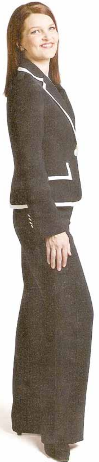
Kauppalehti Optio 4/11

Eduskuntaryhmän puheenjohtajalla Kimmo Tiilikaisella on menossa koeaika. Hallitusohjelman eduskuntakäsittelyssä työnäytteenä esitetty ryhmäpuheenvuoro hakkasi kirkkaasti perussuomalaisen Pirkko Ruohonen-Lernerin, jonka suoritus oli kovin vaisu. Vaihtoehdot jäivät molemmilta varsin vähiin.